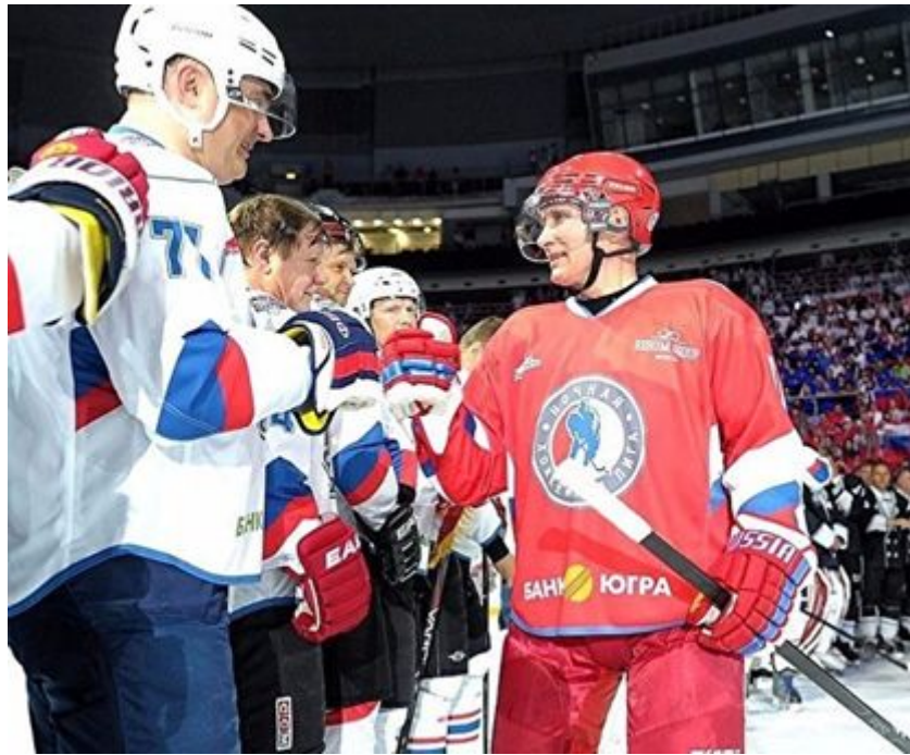
А такие фотографии с игр НХЛ в 2015 году: