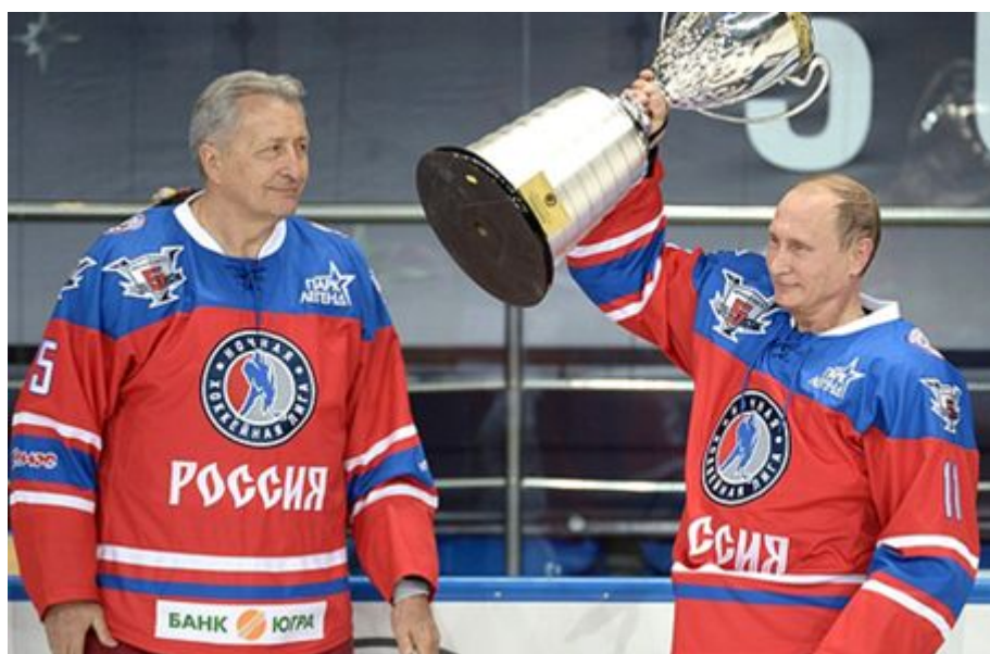
Опытный взгляд заметит нюанс, появившийся после 2015 года.

Доступ к неограниченной рекламе на федеральных каналах является уделом избранных и доступ был предоставлен в полном объеме.